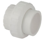
مهبره ماسوره PP PP Union