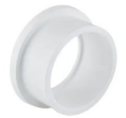
فلنج PP PP Flange Adaptor